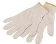
清掃用具提供のイメージ (会社ロゴ入り手袋など)