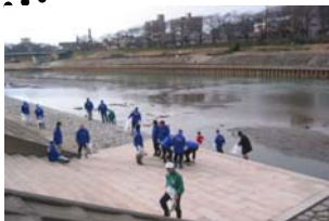
河川公園清掃活動のイメージ